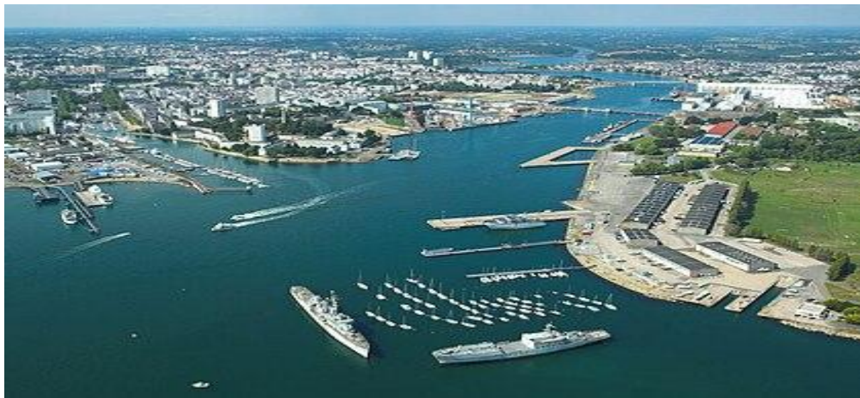
La Rade de Lorient – ville aux 5 ports

Edition 89 / juin 2025 – journal des donateurs et amis de l'association