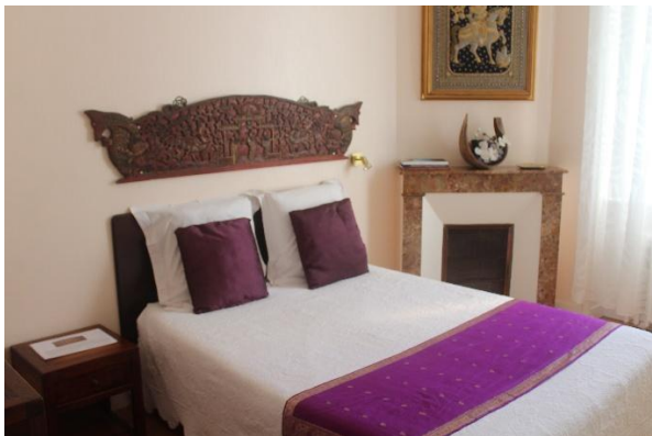
Une chambre birmane