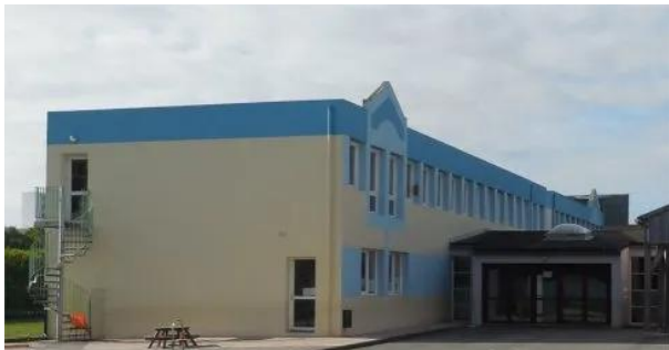
En 1992, le hall d'accueil primaire ainsi que le préau extérieur sont mis en place.

Lors de la construction de cette école primaire, les Frères de Saint-Joseph ont voulu commémorer le nom du fondateur de leur Collège - Lycée de la Rue de Kerguestenen à Lorient : Le Frère François Tanguy