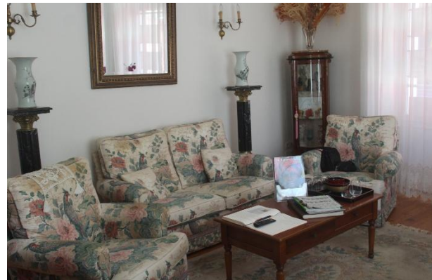
Un salon reposant