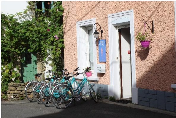
Une entrée accueillante