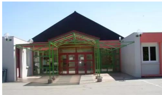
Nouvelle entrée en 2014