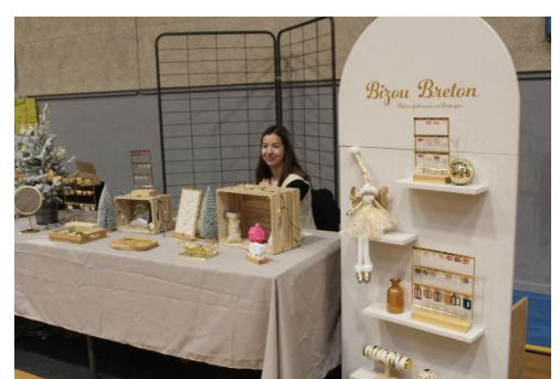
Des stands très attractifs