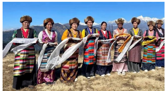
népalais en tenue traditionnelle