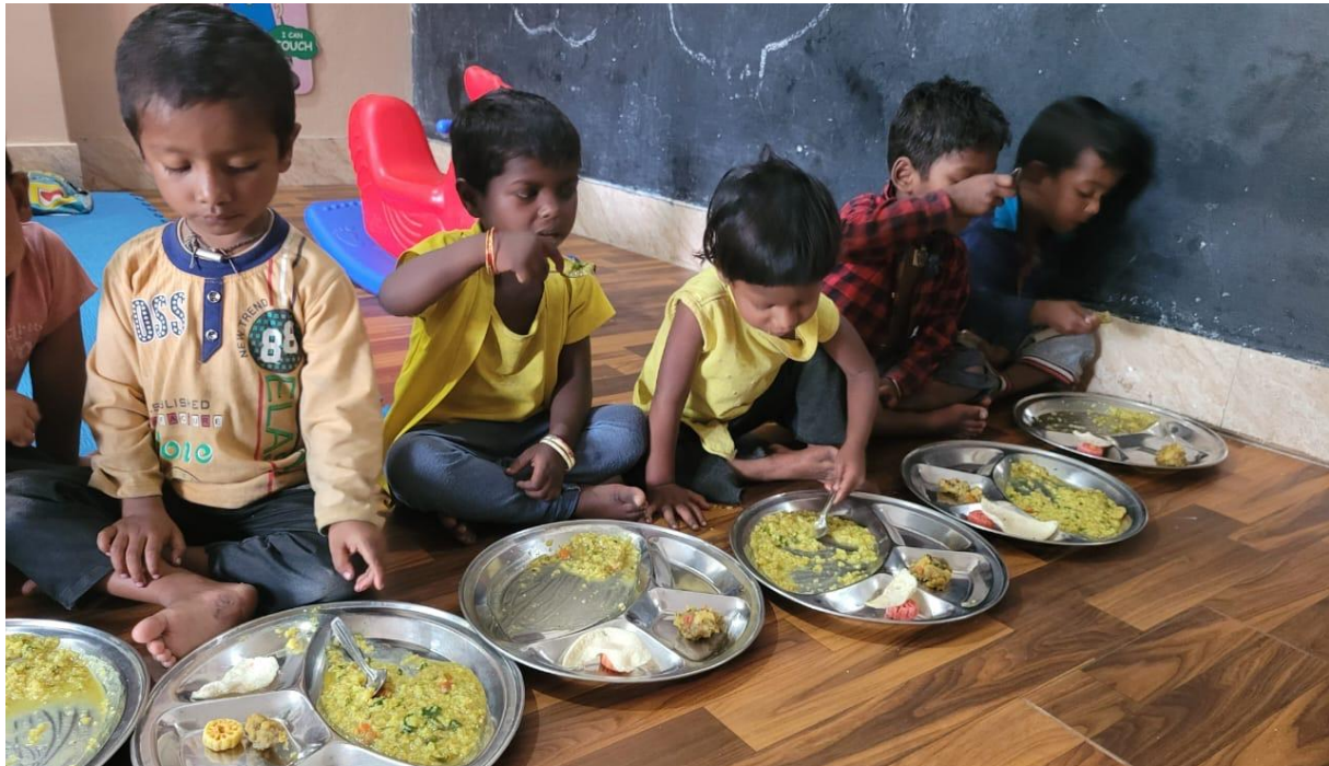
Buddha's Smile School - 230 enfants - Bénarès