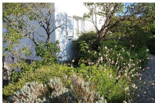
Acer Palmatum Osakasuki Louna